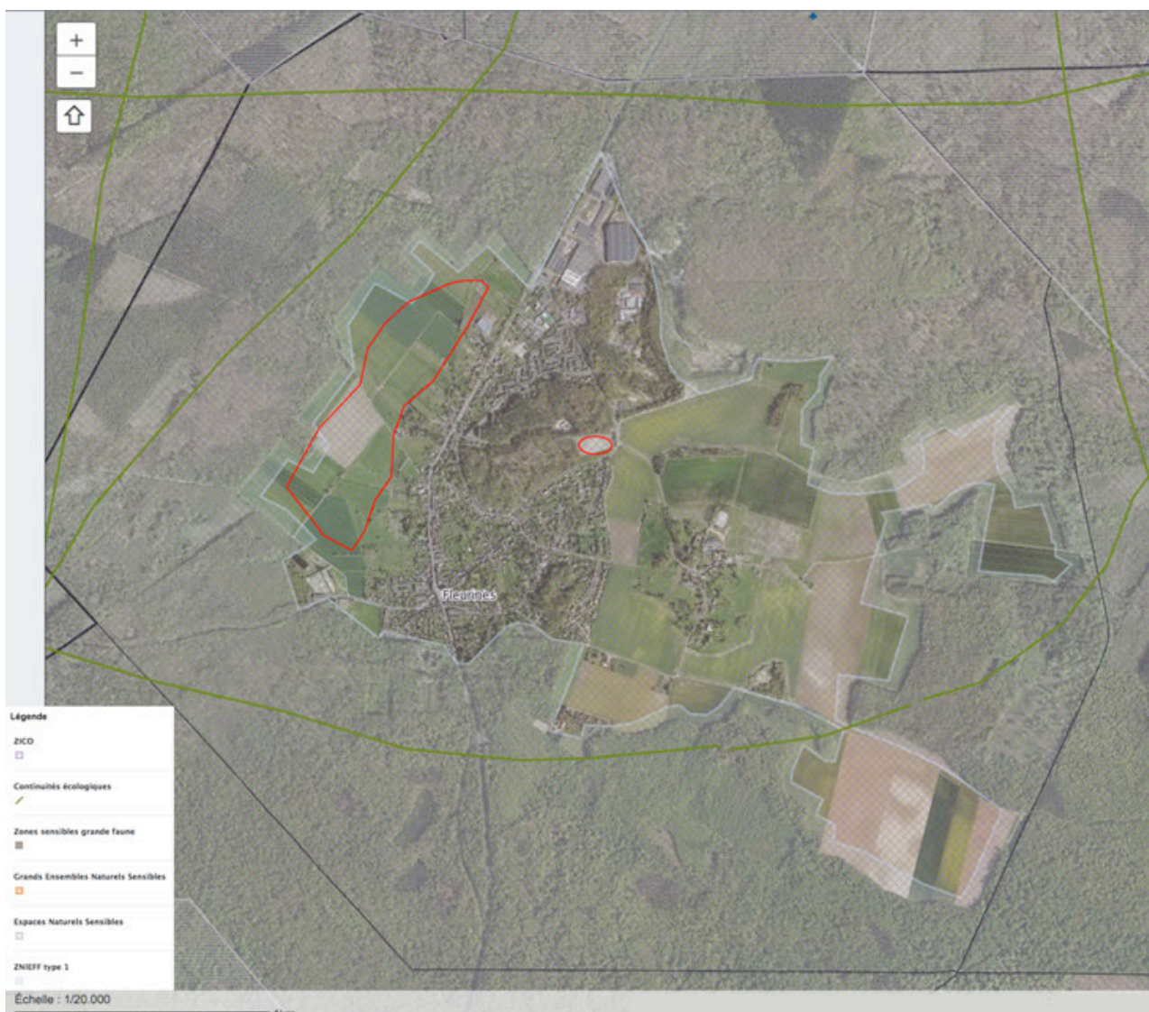
Secteurs à enjeux environnementaux concernant la biodiversité sur le territoire communal et secteur concerné (en rouge) par la modification simplifiée n°1 du PLU.

Il n'est pas constaté d'incidences éventuelles sur les autres enjeux environnementaux concernant le territoire communal de Fleurines , dans le cadre des ajustements apportés au dossier PLU par cette procédure de modification simplifiée n°1.