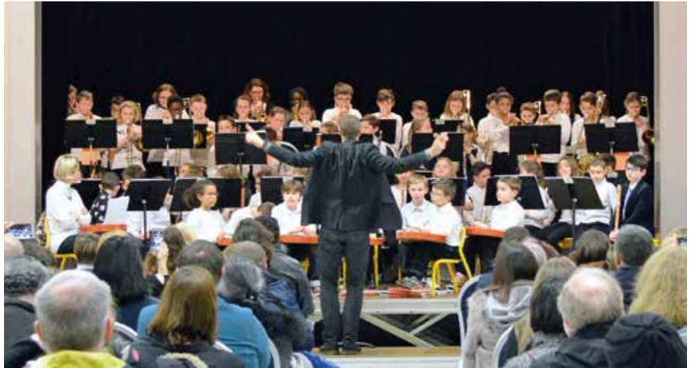
De jeunes musiciens concentrés devant un public attentif

Le vendredi 2 février à 19H00, les élèves de l'école élémentaire ont donné leur premier concert de l'année et pour les CE2 leur tout premier concert. Le traditionnel rendez-vous hivernal s'est déroulé dans la Salle des Fêtes de Verneuil-en-Halatte qui permet d'accueillir nos jeunes musiciens ainsi que leurs familles. Les sons des cuivres, des bois, des flûtes à bec et des cithares se sont succédés ou se sont mélangés pour finir en apothéose sur « Je joue de la musique » de Calogero, air que les enfants avaient joué pour « la rentrée en musique » en septembre. Ce concert fut aussi honoré de la discrète présence du conseiller pédagogique « musique » de l'Education Nationale et de la responsable de l'association « Orchestre à l'école » qui avait permis de finan-