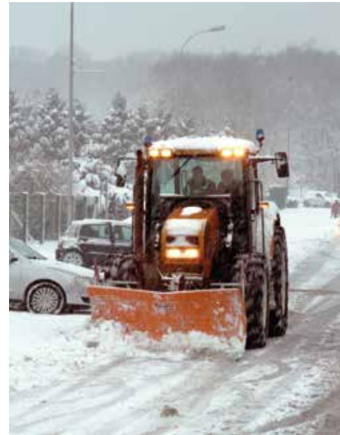
Déneigement rue de la Vallée