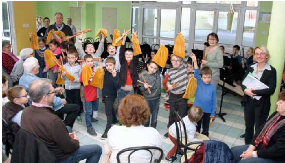
Un joli moment d'échange intergénérationnel

La journée du 23 février a été consacrée à la confection de fleurs pour décorer les chars de la « Fête de la brioche » et s'est poursuivie par une soirée « pizza » avec l'ensemble des participants.