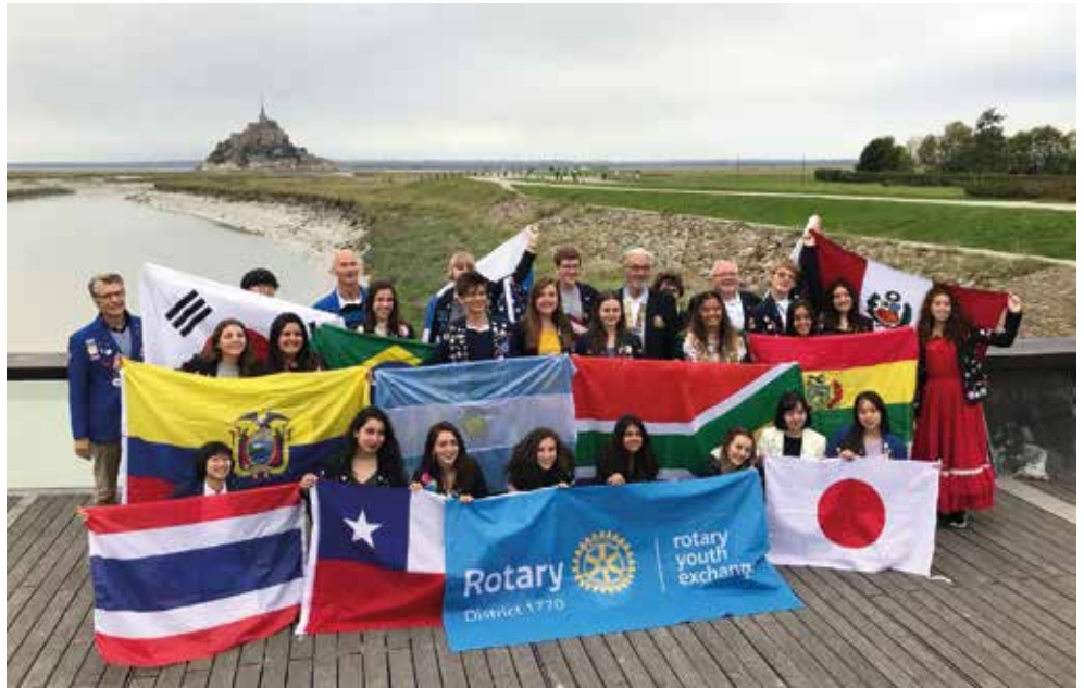
Un beau regroupement de nationalités devant le Mont-Saint-Michel

Au lycée, les premiers jours, j'ai trouvé les élèves français très stressés à cause du bac. Ils en parlent tout le temps. Au Chili, il y a 4 ans de scolarité au lycée. Le bac est une formalité au bout de trois ans qui valide le cursus. Mais l'examen important, c'est celui qui se prépare lors de la quatrième année pour l'entrée à l'université.