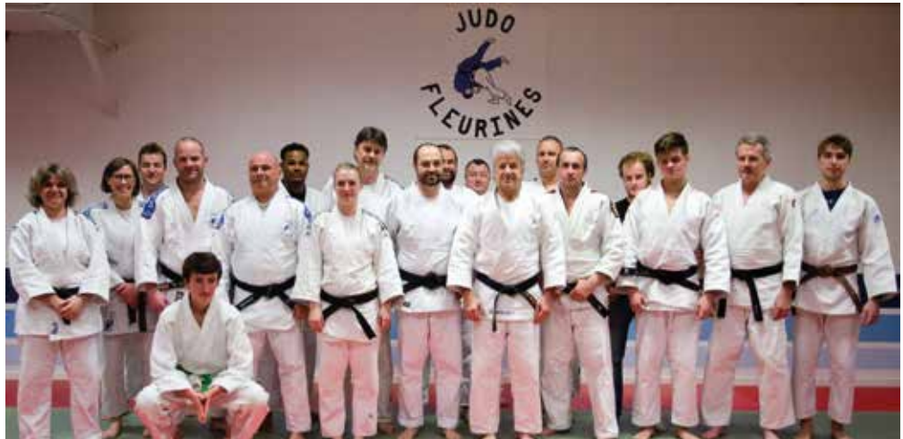
le groupe des judokas réuni pour la remise des ceintures

« Techniquement non, je ne suis pas champion du monde, mais c'est