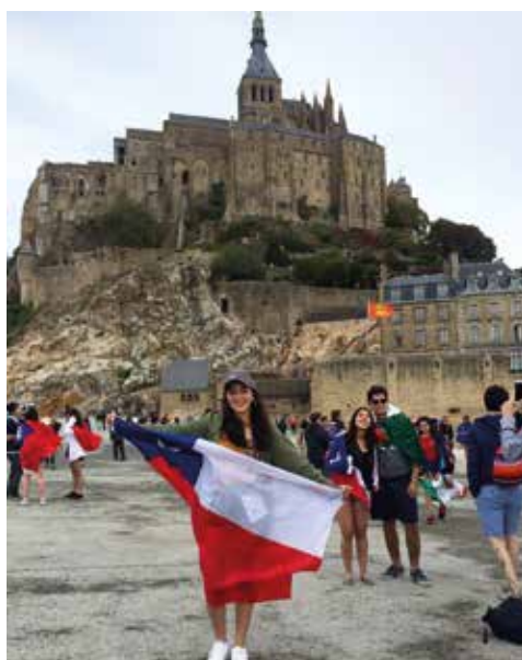
Découverte du Mont S t -Michel

Mon séjour en France dure 10 mois, je repartirai en juin. C'est le Rotary Club, auquel je me suis inscrite, qui organise ces échanges linguistiques et culturels. Je suis en France avec beaucoup d'autres jeunes qui viennent de différents pays que je retrouve au cours des sorties que nous faisons et j'ai aussi des amis du Rotary à Beauvais.