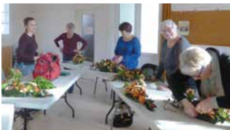
Initiation à l'art floral