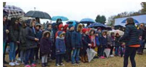
Une Marseillaise chantée avec entrain malgré la pluie

Les Fédérés, partis de Marseille et en marche sur Paris pour envahir les Tuileries, entonnent ce chant durant leur long périple. Rebaptisé alors « Chant de guerre des armées aux frontières », cet air fait grande impression lors de leur arrivée triomphale à Paris le 30 juillet