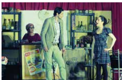
« Mon bac ? Ça fait deux fois que je le rate pour rester dans ta classe ! »

Les événements les plus improbables s'enchaînent dans ce « Café des Sports » tenu par Ginette, situé en face du cimetière. Les habitués et les familles endeuillées se croisent autour d'un verre, entraînant des dialogues parfois sérieux mais souvent totalement décalés