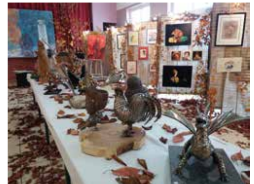
Une exposition riche et variée

Un grand merci également à tous les bénévoles qui ont donné de leur temps et de leur énergie pour que cette manifestation soit une belle réussite !