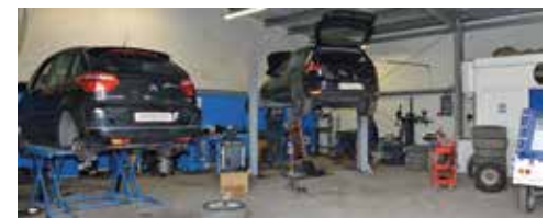
L'atelier de réparation

Notre activité de mandataire va certainement nécessiter la création d'un site internet dédié et je réfléchis également à une boutique en ligne pour les pièces détachées. Nous cherchons toujours plus à nous intégrer dans notre environnement, par exemple nous sommes labellisés « Chimec Environnement » pour le recyclage des huiles et polluants, nous sommes convaincus par l'utilité de la formation en alternance et contribuerons prochainement aux actions de la classe orchestre. A court terme, j'aurai le plaisir d'offrir 10% de réduction sur les réparations durant tout le mois de décembre 2017 aux lecteurs du Fleurines & Vous.