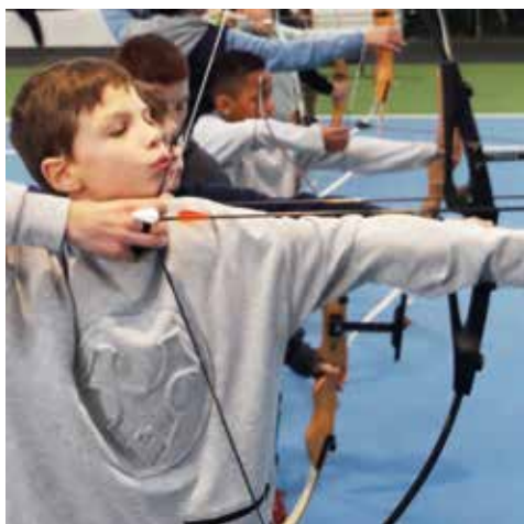
De jeunes archers motivés