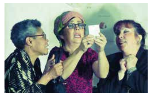
« C'est un billet gagnant ! » - « Combien ? Combien ? »

ravi les spectateurs hilares toute la soirée ! Bravo aux comédiens pour cette prestation réussie !