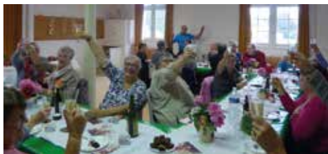
On trinque !

tion, ce fut un clin d'œil à Halloween pour fêter l'arrivée de l'automne.