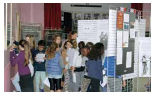
Les CM1 et CM2 en visite à l'exposition sur la Résistance

restituent l'âpreté de l'époque, mêlant leur petite histoire à la grande, rappelant les souffrances endurées mais aussi et surtout leur inextinguible soif de liberté. L'émotion des spectateurs silencieux et attentifs était perceptible dans la salle.