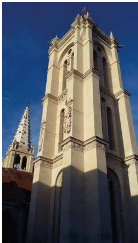
Eglise St-Pierre à Senlis