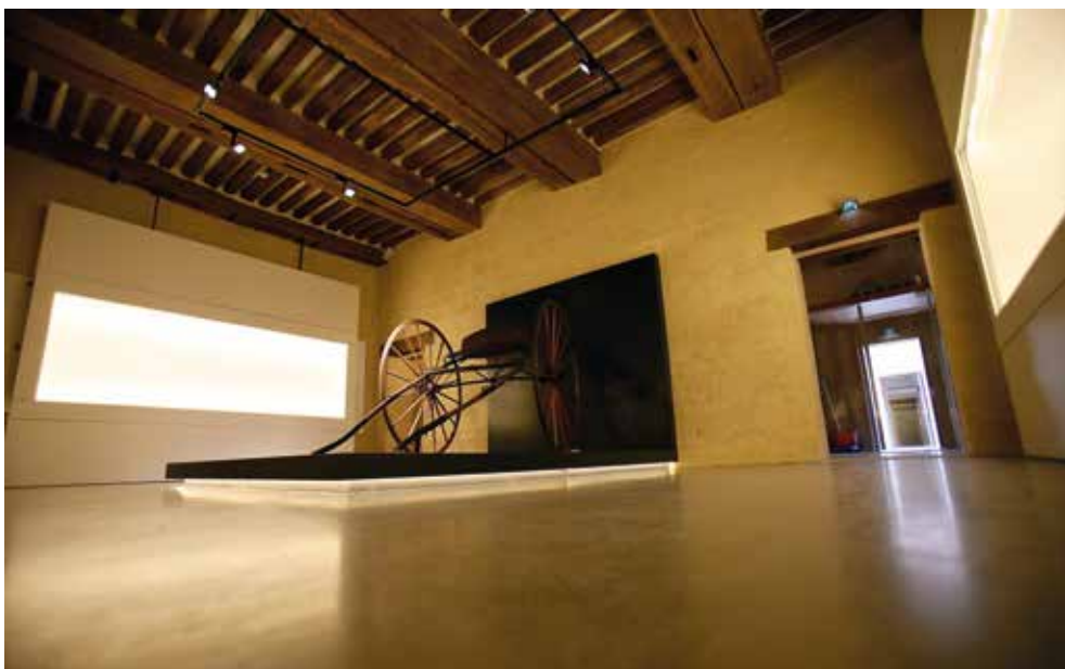
Musée du cheval à Chantilly

Notre agence de Fleurines est une PME de 36 salariés. Nous sommes tous de la région. Je pense que nous représentons un patrimoine vivant. Je ne vois pas un édifice comme un amas de vieilles pierres, mais je vois des gens qui ont un