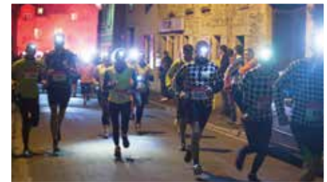
C'est parti !