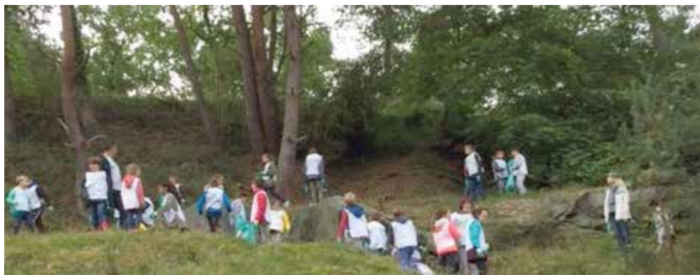
« Nettoyons la nature » pour former de futurs citoyens respectueux de la planète

L e lundi 25 septembre, les élèves de l'école élémentaire Roquesable ont participé à l'opération « Nettoyons la nature ». Equipés de gants et de chasubles, ils ont ramassé des déchets trouvés tout au long du trajet depuis l'école jusqu'à la piscine municipale. Cette opération s'inscrit dans le projet Eco-Ecole qui se poursuit cette année.