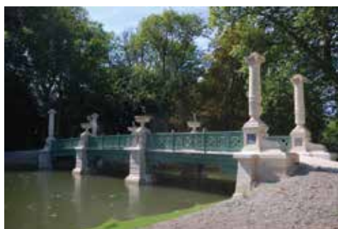
Jardin du château de Chantilly

Nous sommes installés depuis fin juin. Nous n'avons pas fait beaucoup de travaux, juste le sol et l'inauguration s'est déroulée fin septembre. Nous bénéficions d'un local de 750 m 2 construit dans les années 1990. Une grande partie est aménagée en bureaux, mais il y a aussi un dépôt permettant de protéger les matériaux comme les chaux et autres liants. Nous souhaitons créer un atelier de taille qui permettrait de tailler à l'abri en période d'intempéries. Nous devrions pouvoir l'équiper début 2018 pour débuter cette activité en intérieur avec des machines pour capter et colmater les poussières afin d'éviter toute nuisance pour nos voisins.