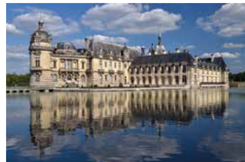
Château de Chantilly

la Picardie et le nord de l'Ile-de-France mais notre activité se concentre au sud de l'Oise, sous une ligne Beauvais-Compiègne-Soissons. Fleurines permet un accès facilité vers toutes ces communes, en particulier Senlis et Chantilly c'est donc parfait.