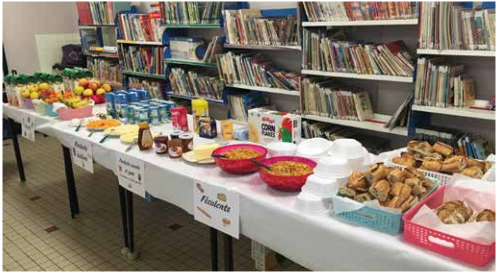
Les Ateliers du goût à l'école

Les élèves répartis en groupes ont pu participer à six ateliers tout au long de cette semaine sur les thèmes de l'odorat, du goût, de la vue, de l'ouïe et du toucher, un atelier autour de la composition d'un menu équilibré et enfin un atelier vidéo présentant un film documentaire sur la nutrition.