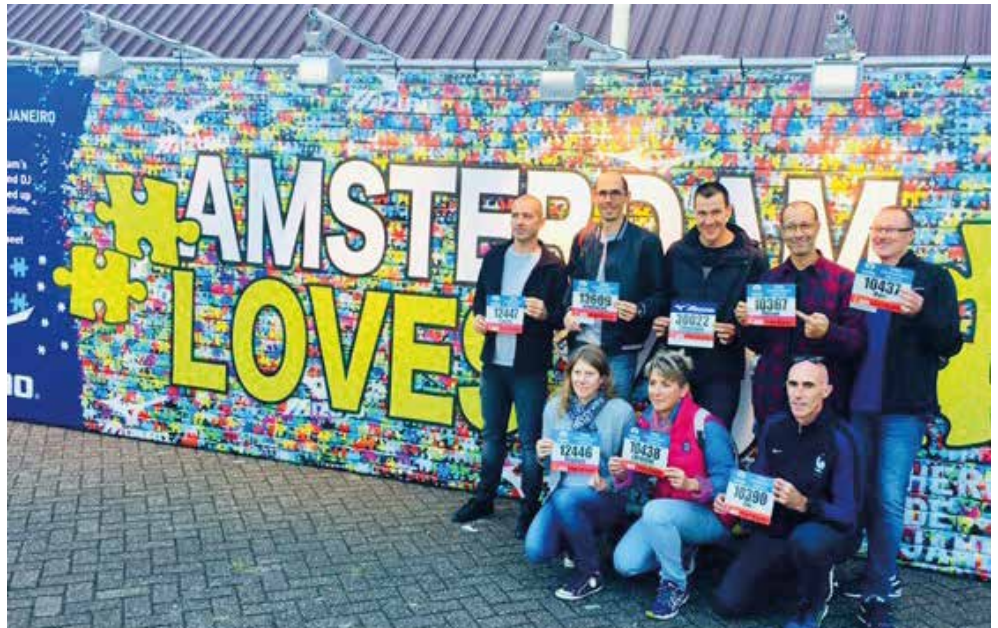
Les « Cofiens » présents au marathon d'Amsterdam

chaque membre du COF est reparti du stade avec sa médaille et malgré tout l'envie de courir de nouveau un jour sur la distance mythique des 42,195km, là-bas ou ailleurs.