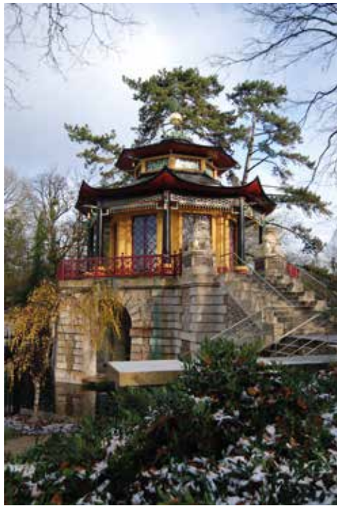
Pavillon Chinois à l'Isle-Adam

Nous travaillons beaucoup sous les directives des Architectes des Bâtiments de France (ABF) mais aussi avec des Architectes en Chef des Monuments Historiques ou du Patrimoine.