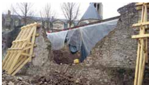
Rempart Bellevue à Senlis

Il n'y a pas de règle. Du fait que nous intervenons sur du patrimoine de petites communes où l'enjeu financier est important, nos chantiers peuvent se dérouler en plusieurs tranches sur plusieurs mois ou années. Pour une église, il peut y avoir deux, trois ou quatre tranches, ce qui permet d'éclater le financement des partenaires publics (Conseil Départemental, DRAC, etc.)