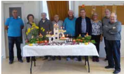
Joyeux anniversaire !

J eudi 5 octobre, les adhérent(e)s de l'Amicale né(e)s entre avril et septembre furent mis à l'honneur. Gâteaux, bulles et cadeaux ont égayé cet après-midi dédié aux anniversaires. Quant à la décora-