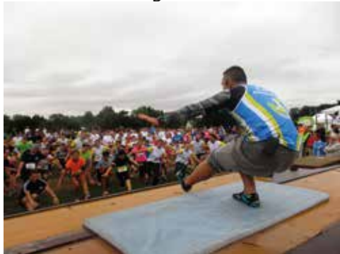
Echauffement collectif avant le départ

De nombreux Fleurinois, en couple et en famille, sont venus s'adonner aux joies de la course à pied, arborant tous un large sourire.