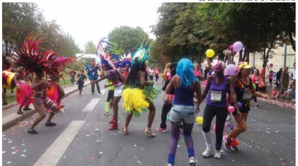
Le carnaval s'invite à la Parisienne

Quelques Fleurinoises déguisées étaient de nouveau au départ. Après plusieurs heures d'attente (sûreté oblige), ces dames ont