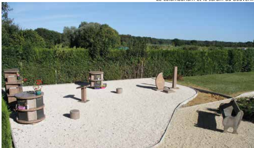
Le columbarium et le Jardin du Souvenir

Parallèlement à ces travaux importants, l'équipe des Services Techniques de la mairie a aménagé l'espace du columbarium (allées, bordures, trottoirs, gravillons) et un Jardin du Souvenir a été créé. Des rosiers seront bientôt plantés pour agrémenter cet espace.