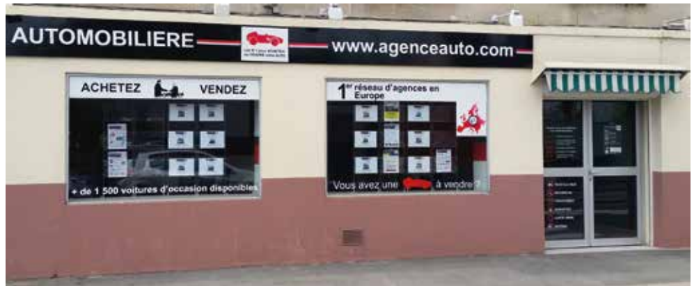
La vitrine de l'agence, rue du Général De Gaulle

Fin mai, j'ai été contacté par l'équipe de M6 pour le tournage puis on m'a appelé une semaine avant la diffusion de l'émission pour m'en indiquer la date : le 4 septembre. Entre ces deux dates, je n'avais eu aucune nouvelle. Je ne savais absolument rien de ce qui serait diffusé, ni ce qui serait dit lors de l'émission. Le thème du reportage était « les nouvelles tendances pour vendre son véhicule ». Quand ils sont venus, ils ne nous avaient pas dit qu'ils faisaient une étude comparative, il était seulement question de faire découvrir notre concept. Le tournage a duré une journée complète, il pleuvait. Ils sont arrivés vers 9h30, nous avons déjeuné ensemble puis ils sont repartis vers 16h00. J'avais une cliente ce jour-là qui avait rendez-vous à 11h00. Ils l'ont appelée la veille pour savoir si elle acceptait d'être filmée et si elle ne serait pas « bloquée » devant les caméras. L'équipe était sympa, il y avait un cameraman, un journaliste et un perchiste pour le son. Nous avons eu un beau reportage par rapport à d'autres sociétés de reprise de véhicules d'occasion sur internet qui ont été critiquées. L'effet télé fonctionne bien car l'émission était à peine terminée que je recevais des mails.