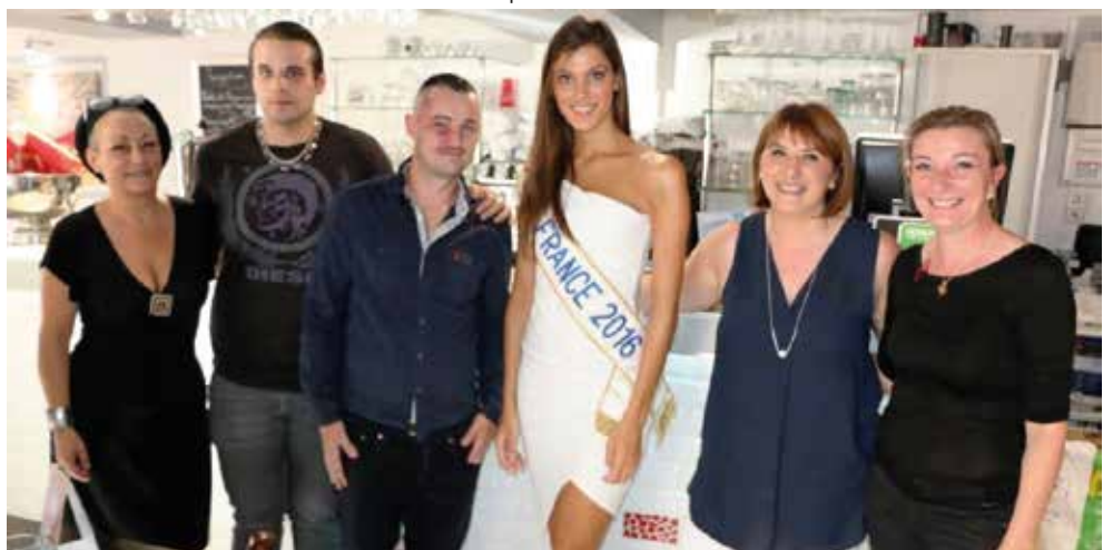
Le personnel de la Traviata heureux d'accueillir Miss France

Entre deux séances de dédicaces, notre Miss nationale est venue à Fleurines se reposer et se restaurer au restaurant La Traviata où, là non plus, elle n'a pu échapper aux traditionnelles photos avec le personnel pour le plus grand plaisir de tous !