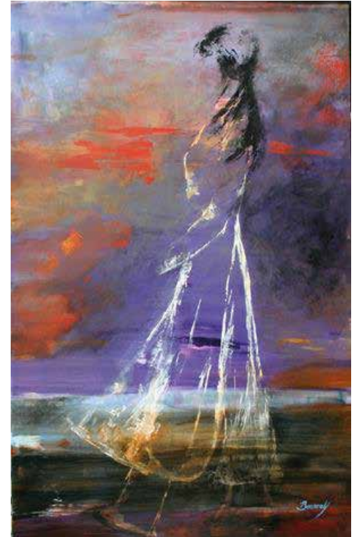
« Elle », huile sur toile de Christine Bourcey