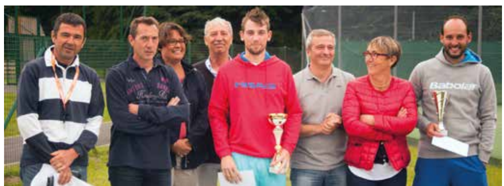
Une coupe pour les messieurs

Rendez-vous pris l'an prochain pour la 8 ème édition.