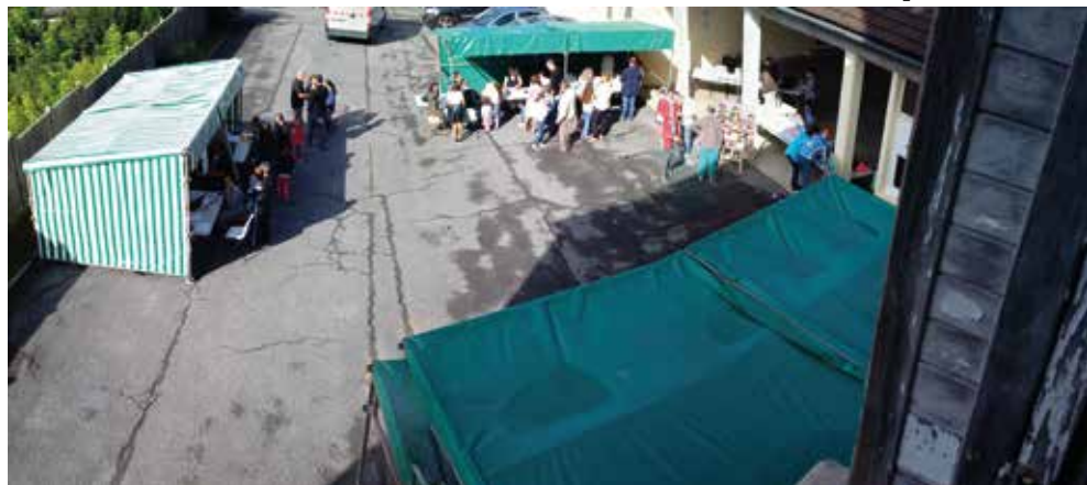
Forum des associations 2015 dans la cour de l'ancienne école

Les associations fleurinoises vous donnent rendez-vous le dimanche 4 septembre prochain pour vous présenter leurs activités, leurs projets et le programme de l'année 2016-2017.