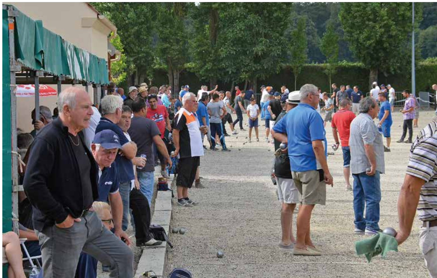
Un boulodrome bien rempli en juillet