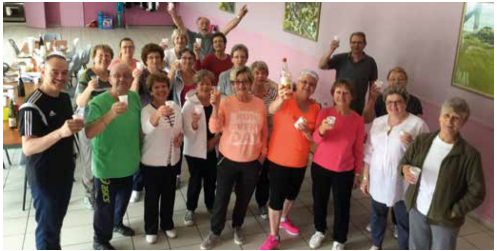
Pot de fin d'année, juin 2016

Donc rendez-vous mardi 13 pour une reprise dans la bonne humeur et la convivialité !