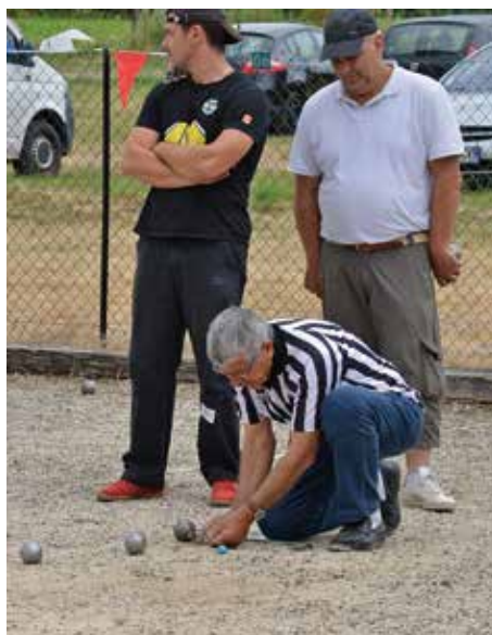
Suspense : laquelle est bonne ?

Pour conclure, nous pouvons nous donner rendez-vous l'année prochaine pour un nouveau record ? J'espère bien ! Avec le soutien des bénévoles, du Conseil Départemental et de la Commune nous avons organisé cette année un très beau festival.