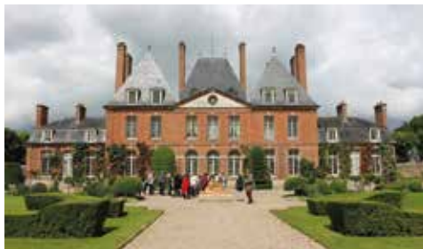
Le château d'Ermenouville (Seine-Maritime)

Les visiteurs ont pu flâner dans la roseraie contenant plus de 2700 rosiers et le potager romantique, classé parmi les plus beaux de France, où sont cultivés des légumes d'autrefois.