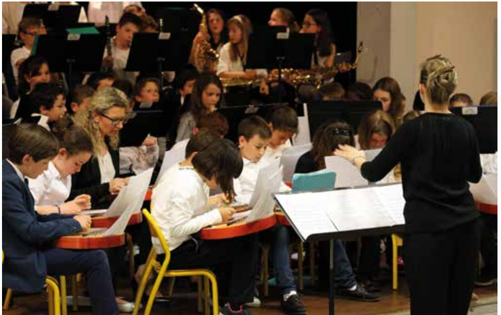
Concentration maximum des musiciens pendant le concert

C'est au travers des aventures de Pierre-Lou Traveler et Evan Fotomaton, tous deux partis à la recherche du Tabou, que se sont illustrées nos trois classes-orchestre, jouant parfois seules, à deux classes ou tous ensemble.