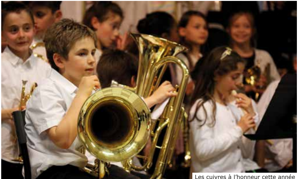
Les cuivres à l'honneur cette année

Une belle aventure qui aura permis à certains d'entre eux de découvrir