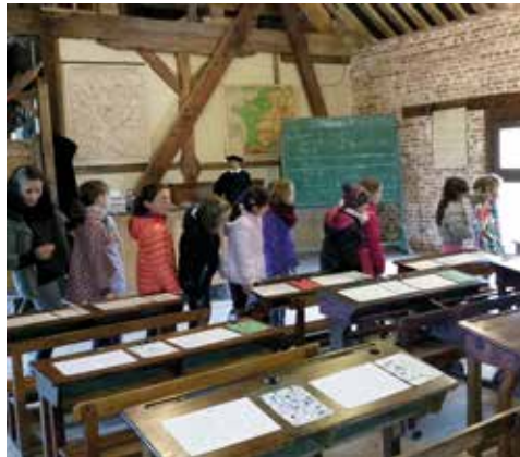
Retour à l'école d'autrefois