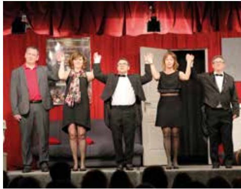
Bravo à la Troupe de Verneuil !

et répliques hilarantes pour ce diabolique jeu du chat et de la