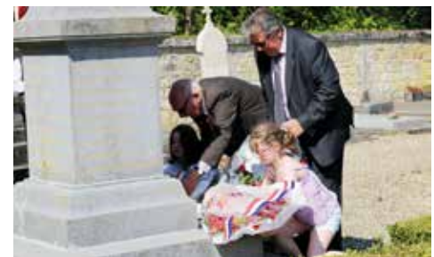
Dépôt de gerbes au pied du Monument aux Morts

Viendront s'ajouter prochainement à ces dates le 27 mai, Journée Nationale de la Résistance depuis 2014, puis le 76 ème anniversaire de l'Appel du 18 juin.