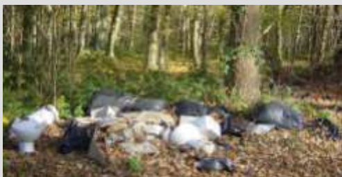
La forêt défigurée par des individus sans scrupules.

Nous rappelons que les particuliers peuvent déposer les gravats, gros matériels électriques et produits chimiques (restes de