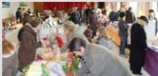
Le stand de l'association Temps Danse Détente parmi les exposants installés dans la salle des fêtes.

L'arrivée du Père Noël chargé de bonbons et de cadeaux enchantés les petits et les grands enfants.