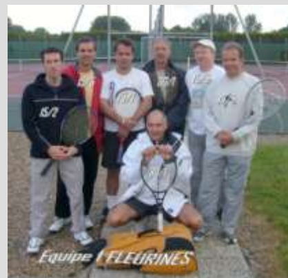
L'équipe 1 Messieurs jouera les quarts de finale inter-poule le dimanche 10 janvier à Ailly-sur-Noye (Somme)