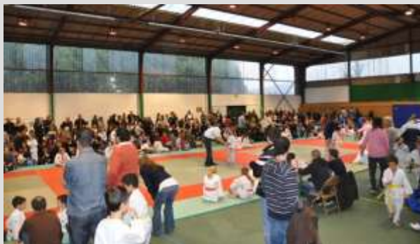
Affluence de judokas à la salle des sports.

Le samedi 21 Novembre, le Judo Club de Fleurines a organisé sa première animation de la saison. 17 clubs du département ont répondu présents et ce sont quelques 250 participants que nous avons accueilli dans le gymnase où cette manifestation