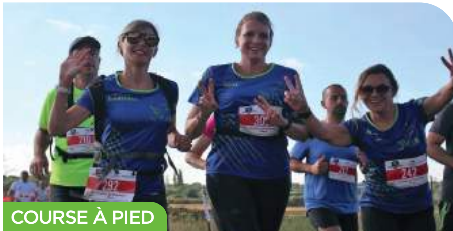
COURSE À PIED

des bénévoles toujours à la hauteur de l'événement.