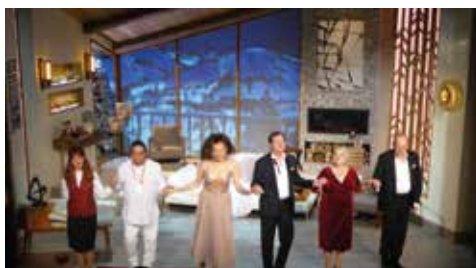
Un spectacle réjouissant au Théâtre des Nouveautés

Le 15 janvier, l'Amicale ainsi que des membres de l'association de Chamant se sont rendus au Théâtre des Nouveautés pour assister avec plaisir à la représentation de la pièce : « Un chalet à Gstaad ». Après le spectacle,