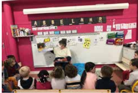
Lecture de contes à la maternelle

Le jour suivant s'est déroulé le traditionnel concours des gâteaux de Noël. Tous les participants ont réalisé un gâteau sur le thème. Après la collecte des photographies de gâteaux, il fallait faire élire le plus beau gâteau de Noël dans chaque classe par une autre classe. Chaque gagnant a reçu un diplôme et un petit mug de saison. Tous les concurrents