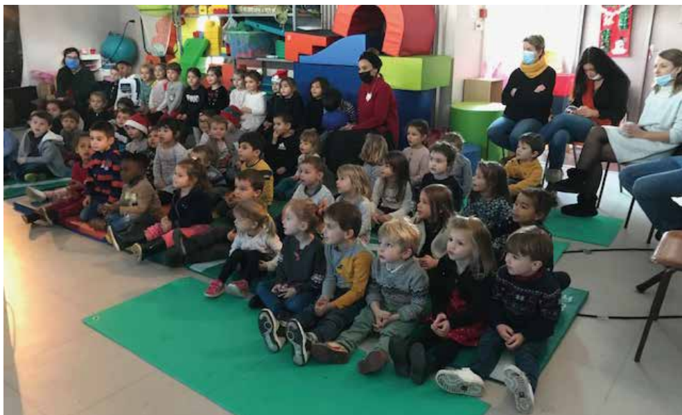
Les enfants captivés par le spectacle « Le Noël des petits ramoneurs »

Les enfants ont pu assister au spectacle "Le Noël des petits ramoneurs". Ils ont répété, au sein de leur classe, deux chants ou comptines de Noël pour faire une surprise à leurs parents!