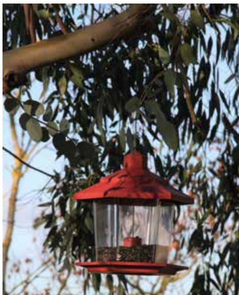
Mangeoire pour les mésanges

En accord avec le PNR, la Ligue Protectrice des Oiseaux, l'équipe municipale et M me Juredieu, il a été décidé faire participer les enfants de