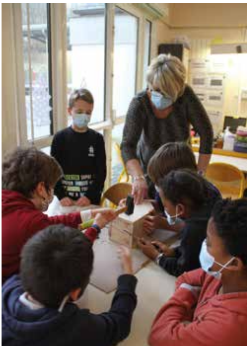
Atelier de construction de nichoirs à mésanges (CM1 /CM2)

Dans le cadre de la maîtrise de la prolifération des chenilles processionnaires du chêne aux abords de l'école Roquesable, il a été décidé d'installer des nichoirs à mésanges. En effet, la mésange est le plus grand prédateur naturel de la chenille processionnaire. Sa présence sur des zones infectées est un atout primordial dans la lutte alternative contre celle-ci. Une mésange peut en effet vider à elle seule le nid d'hiver de la processionnaire.